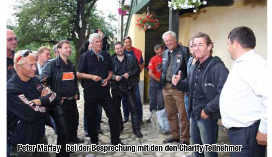
Peter Maffay bei der Besprechung mit den den Charity Teilnehmer

Doch starke Ideen brauchen starke Partner: Vom 22. bis 25. Juli ging Maffay deshalb auf Tour, nahm als Begleitung für guten Sound aber nicht seine Gitarre, sondern seine Harley mit. Die Heitzig Service Agentur hatte